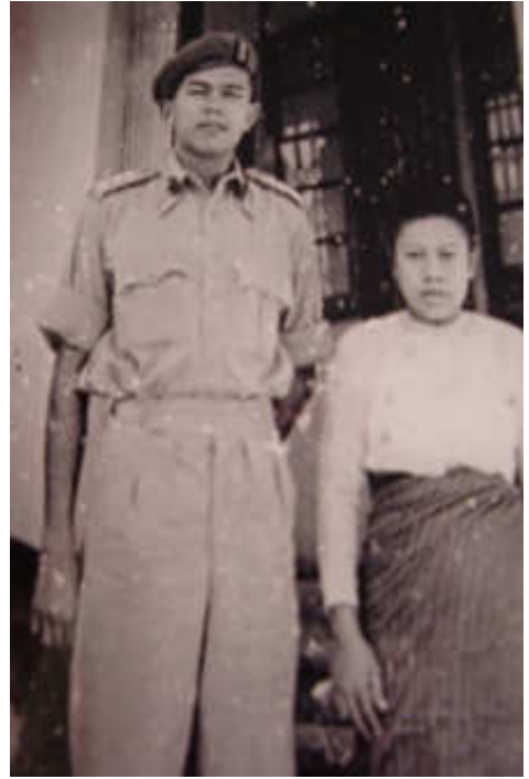
၁၉၄၉ ခုနှစ်အတွင်းက ဖေဖေနဲ့ မေမေ - အဲဒီကာလ ကာကွယ်ရေးဝန်ကြီး ဗိုလ်လကျော် အိမ်ရှေ့မှာ