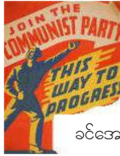
ခင်အေးကြည်မြ

တောင်အာရှမှာ မော်လ်ဒိုက်နိုင်ငံမှအပ အိန္ဒိယ၊ ပါကစ္စတန်၊ ဘင်္ဂလားဒေ့ရှ်၊ နီပေါ၊ သီရိလင်္ကာ၊ ဘူတန်နဲ့ အာဖဂန်နစ္စတန်နိုင်ငံတို့မှာ ကွန်မြူနစ်ပါတီတွေ ရှိနေကြပါတယ်။ ဒီကွန်မြူနစ်ပါတီတွေဟာ အင်အားအရ အကြီးအသေး မတူကြပါဘူး။ ၎င်းတို့အနက် နိုင်ယုဉ်ချက်အရ အင်အားကြီးတာက အိန္ဒိယကွန်မြူနစ်ပါတီ (မာ့ကစ်ဝါဒ)၊ အိန္ဒိယကွန်မြူနစ်ပါတီ၊ အိန္ဒိယကွန်မြူနစ်ပါတီ (မာ့ကစ်လီနင်ဝါဒ)၊ အိန္ဒိယကွန်မြူနစ်ပါတီ (မော်စီတုန်းဝါဒ)၊ နီပေါ စည်းလုံးညီညွတ်သော ကွန်မြူနစ်ပါတီ (မော်ဝါဒီ)၊ နီပေါကွန်မြူနစ်ပါတီ (စည်းလုံး ညီညွတ်သော မာ့ကစ်လီနင်ဝါဒ) စတဲ့ ပါတီတွေဖြစ်တယ်။