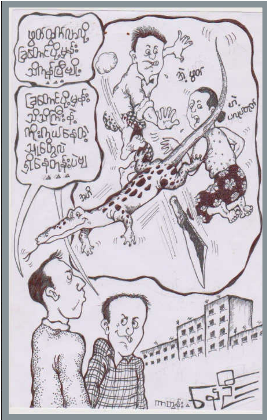
ကာတွန်းနေဦး၏ ယခုတပတ် လက်ရာ(၂)