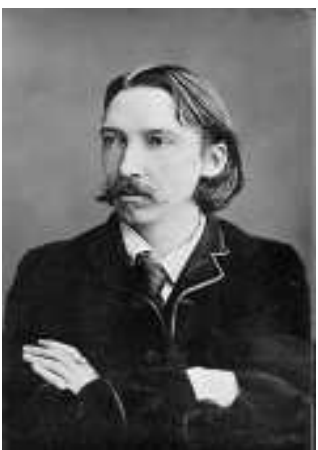
စတီဗင်ဆန်

လွတ်လပ်စွာ ထုတ်ဖော်ခွင့်၊ လူတိုင်းလွတ်လပ်စွာ မဲပေးခွင့်ဆိုသည်မှာ ဘယ်တော့မှ တန်းတူမျှတ မဖြစ်နိုင်ပေ။ လွတ်လပ်စွာ လိမ်ညာခွင့်ပဲ ရှိပေသည်။