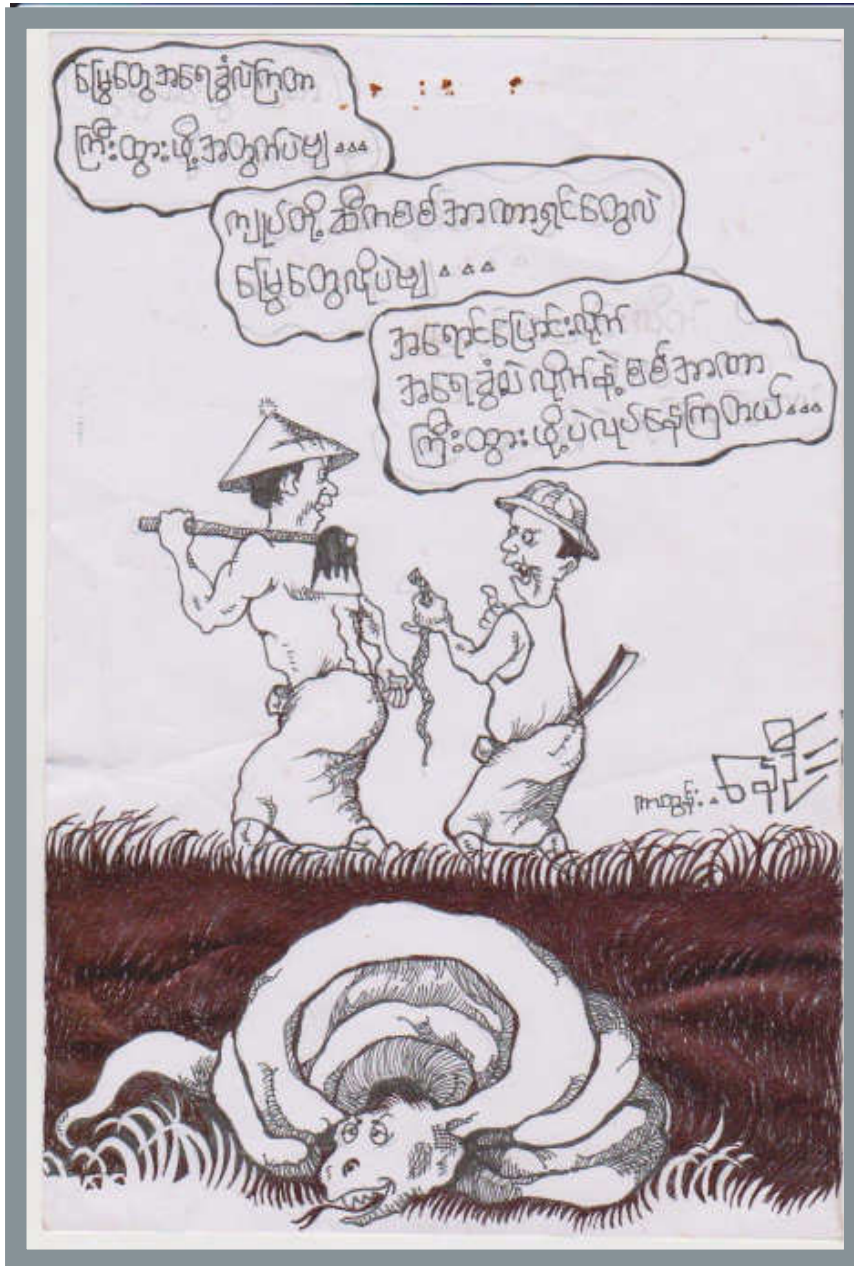
ကာတွန်းနေဦး၏ ယခုတပတ် လက်ရာ(၃)